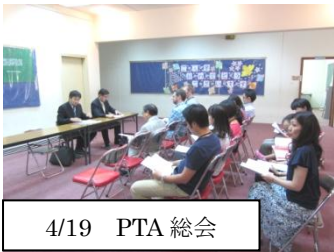
4/19 PTA 総会