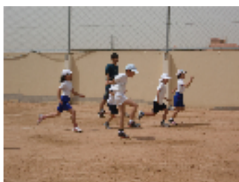
低学年体育：しっかり足を上げて。

児童生徒会活動を教師主導から児童生徒主体へと変えています。子どもたちが、活動内容や目標を考え全校に伝えていく。このことで、学年を超えた連携が深まり、責任感が芽生え、達成感や成就感を味わうことができます。代表委員会、体育委員会、図書委員会、環境委員会があります。より良い学校づくりに子どもたちも参加しています。