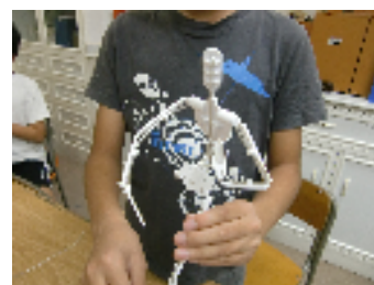
どんな作品に仕上がるのか楽しみです。