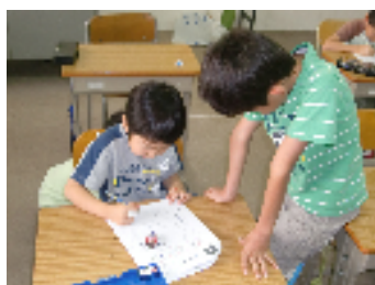
やさしく教えてあげてね。